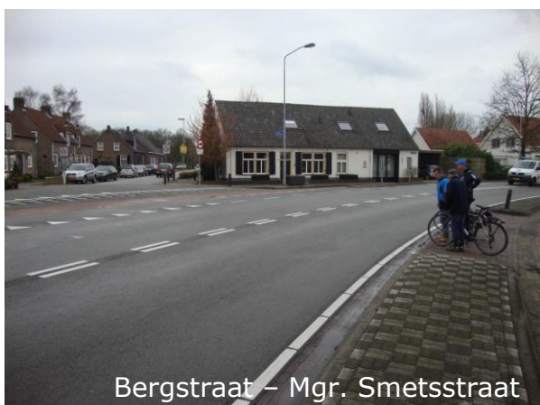
Bergstraat - Mgr. Smetsstraat

De fietsersbond heeft ook geconstateerd dat er op een aantal punten oversteekplaatsen ontbreken of dat deze onoverzichtelijk zijn. Bij de herinrichting van het centrum krijgen de fietser en voetganger in de toekomst een prominente rol. Hierbij wordt dan extra aandacht besteed aan oversteekplaatsen. Daar waar situaties buiten het plangebied van het centrum vallen zullen we op basis van een QuickScan locaties aanwijzen en prioriteren in het uitvoeringsprogramma.