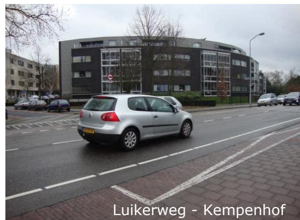
Luikerweg - Kempenhof